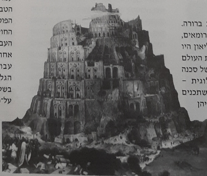
מגדל בבל, פיטר ברויגל, 1563

כאמור, כאשר הורסים את הגומחות, את הלאומיות, נאלצים בני האדם להעמיד את מוצריהם בתחרות בעולם ללא גבולות; ערך המוצר נמדד לפי קנה מידה בינלאומי והוא נקבע, כמובן, על ידי המתחרה הזול ביותר. אולם כאן המלכודת הראשונה: ניתן להשוות את מחירי מוצרי הגלם, הקרקע וכו', אולם כיצד ניתן להשוות את ערך העבודה? אילו היו המדדים האנושיים שווים בכל חברה, היה הדבר אפשרי, אולם בעולם ללא גבולות, יכולות חברות כלכליות להעסיק פועלים במדינות שונות בשכר רעב, או אף במעין עבדות של קטינות וקטינים, או אסירים פליליים ופוליטיים. המוצרים הזולים