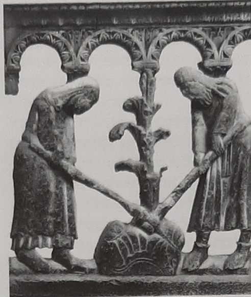
"בגן עדן היה ייעודו של האדם לעבדה ולשמרה..." אדם וחווה עמלים, תבליט אבן, וילינגלמו, קתדרלת מודנה איטליה המאה ה-16

ניסוי מיוחד במינו מתקיים לעינינו בתהליך האיחוד הכלכלי באירופה, ניסוי אשר ילמד אותנו רבות. כוח התחרות של אירופה המאוחדת במאבקה עם המעצמות הכלכליות האחרות יעלה ככל הנראה. אולם, רוצה אני להתנבא שכאשר אחדות אירופה תושלם ויהיה