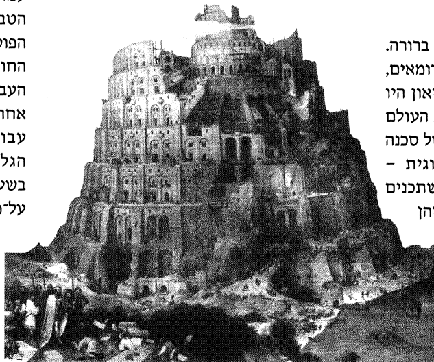
מגדל בבל, פיטר ברויגל, 1563

כאמור, כאשר הורסים את הגומחות, את הלאומיות, נאלצים בני האדם להעמיד את מוצריהם בתחרות בעולם ללא גבולות; ערך המוצר נמדד לפי קנה מידה בינלאומי והוא נקבע, כמובן, על ידי המתחרה הזול ביותר. אולם כאן המלכודת הראשונה: ניתן להשוות את מחירי מוצרי הגלם, הקרקע וכו', אולם כיצד ניתן להשוות את ערך העבודה? אילו היו המדדים האנושיים שווים בכל חברה, היה הדבר אפשרי, אולם בעולם ללא גבולות, יכולות חברות כלכליות להעסיק פועלים במדינות שונות בשכר רעב, או אף במעין עבדות של קטינות וקטינים, או אסירים פוליטיים ופוליטיים. המוצרים הזולים