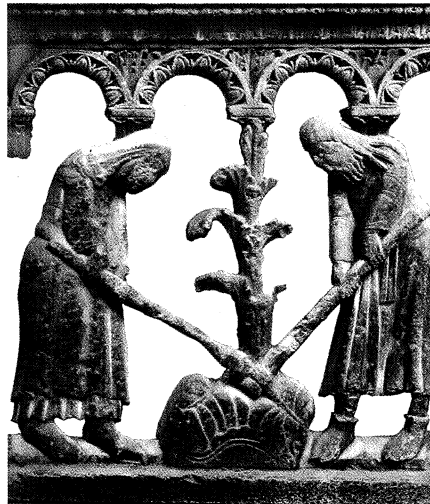
"בגן עדן היה ייעודו של האדם לעבדה ולשמרה..." אדם וחוה עמלים, תבליט אבן, ויליאמו, קתדרלת מודנה איטליה המאה ה-16

ניסוי מיוחד במינו מתקיים לעינינו בתהליך האיחוד הכלכלי באירופה, ניסוי אשר ילמד אותנו רבות. כוח התחרות של אירופה המאוחדת במאבקה עם המעצמות הכלכליות האחרות יעלה ככל הנראה. אולם, רוצה אני להתנבא שכאשר אחדות אירופה תושלם ויהיה